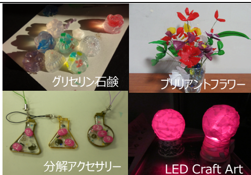
図 1. ものづくり体験講座の作品