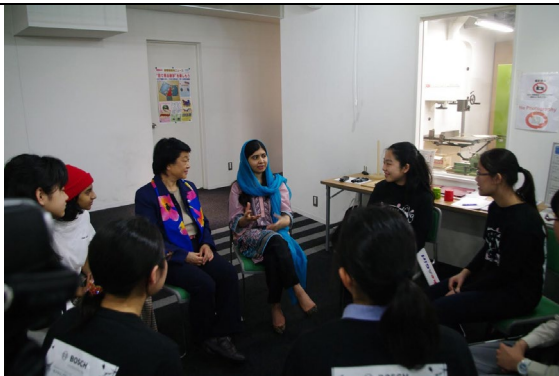
マララ・ユスフザイ氏、向井 千秋氏との女性教育をテーマにした対談