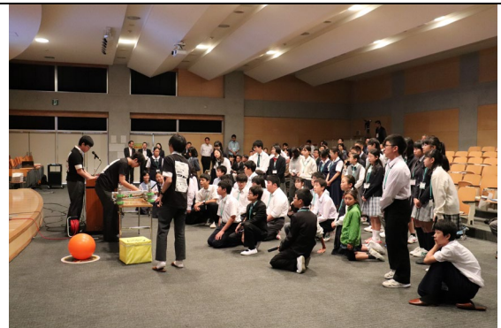
千葉市未来の科学者育成プログラム特別講演