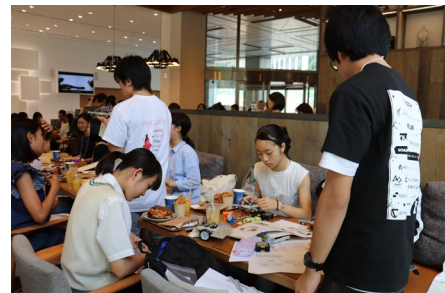
女子中高生向けワークショップ