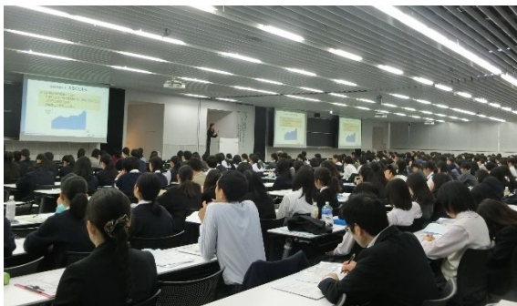
第 11 回交流会 講演（東京都・早稲田大学）