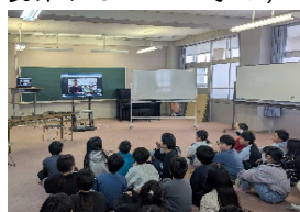
(安田小学校との オンライン交流)

学年探究Ⅱは、摂南大学理工学部と行う「オリーブの葉で発電を行う研究～葉緑体から発電が?～」をテーマに摂南大学教授・学生と協働して探究することである。本校のオリーブの森を育てながら「オリーブを軸とした持続可能な学び」と、同学の研究テーマである「光合成建築」を結びつけることで、児童が日々親しむオリーブの葉を使って科学的探究を行い。更に設計や模型製作することを学ぶ、いわゆるSTEAM教育を意識した探究活動である。具体的には、児童が育てているオリーブの葉で光合成燃料電池を作り、オリーブの枝と幹でツリーハウス制作する。その電池で電気を灯す。この取組は、本校が大切にしている2つのそうぞう（想像と創造）の学びと、同学が研究し、将来的に世に出そうという考えで研究している光合成建築の計画がつながったものである。この探究は小豆島町立安田小学校訪問で、オリーブの木を図工教材として扱っていたところに更に科学的見地を加えて何か将来に繋がる夢を児童に持たせたいという思いが具現化した。植物の特性を生かした発電体験や自然素材を使った創作活動を通して、SDGsにもつながる最先端のサイエンスとアートを次世代を担う児童が体験出来る良い機会とした。