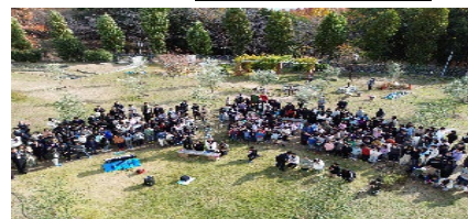
（ドローンによる「感謝祭」撮影）

本校では、ESDの視点に立った学習指導で重視する7観点の内、物事を鵜呑みにしない「批判的思考」俯瞰的に考える「多面的総合的思考」「協力力」「つながる態度」を大事にしている。従来と異なる物事を見る力を付けるために購入させて戴いた「ドローン」によって横から見る普通の生活の視点を変えさせ、上から物を見ることにより児童に多面的な見方更に俯瞰する大事さを学ばせる。研究の充実には、環境を整える必要が大切と既存のオリーブ木に受粉しやすい別の種類の苗木を追加購入し、児童の好きな時にいつでもオリーブに触れられる環境を整えた。オリーブ生産一を誇る小豆島の状況を知る、オリーブと学校教育で最前線に行く小学校の状況把握と今後の交流交渉、牛の餌の改良にオリーブの「搾りかす」を使う研究を实践した畜産家訪問など、本校の探究に直結するテーマのヒントと今後の交流をめざして教員現地視察研修を計画した。オリーブ搾りかすの飼料研究を府立農芸高等学校・オリーブ農家、オリーブ（枝・葉・実）とオリーブの搾りかすの研究は大阪公立大学・摂南大学、将来本校商品が完成した際のマーケティングを関西大学と阪急阪神グループ、地域住民と小学生が共に学ぶ「3世代オリーブ教室」と維持管理は連合自治会の協力を得てスタートした。