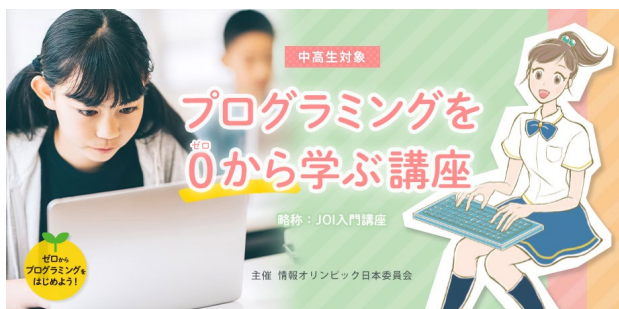
オンラインのプログラミング講座を毎月開催中