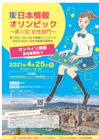
第1回女性部門 ポスター 125名が参加