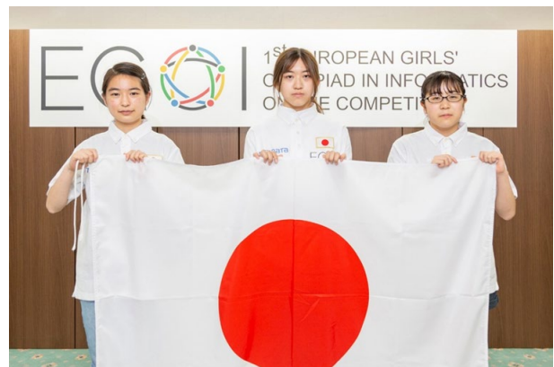
第1回ヨーロッパ女子情報オリンピック日本代表選手