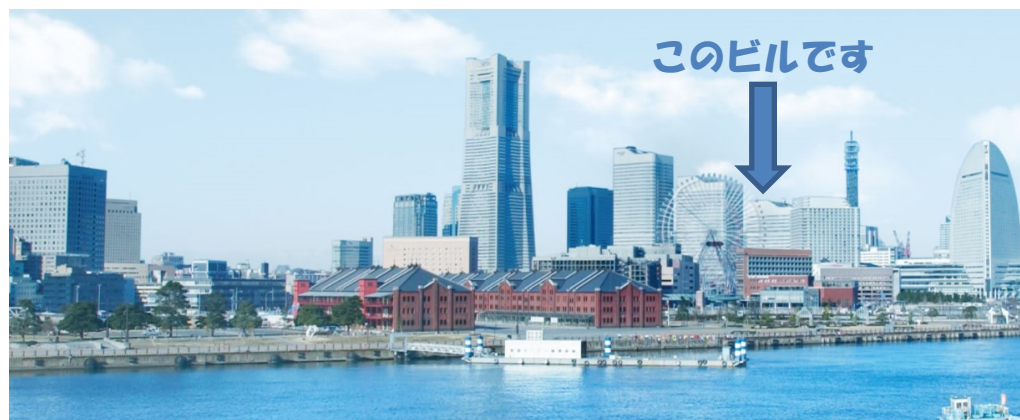
写真上：横浜港から望むみなとみらい地区

ご案内： http://qsy-tqc.jp/access/ （クイーンズスクエアアクセスマップ）