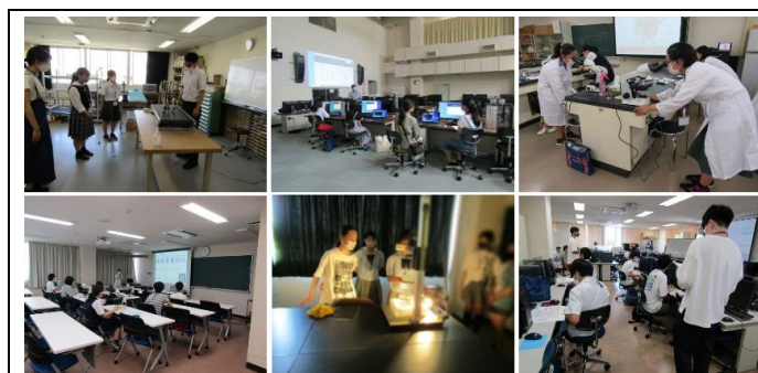
研究者のタマゴになろう