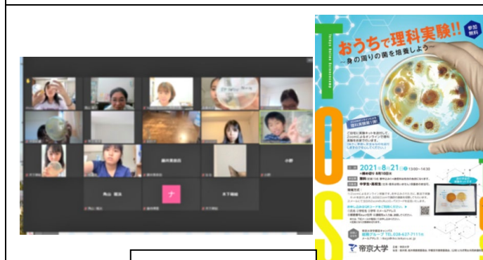
おうちで理科実験