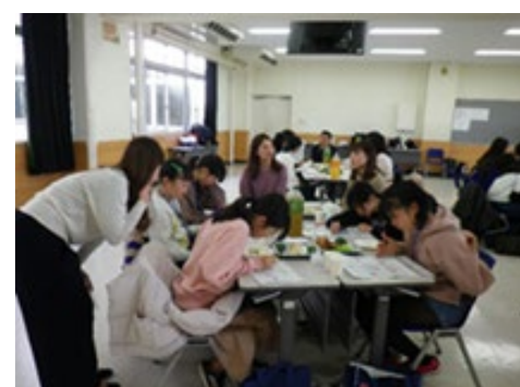
女性企業エンジニアとのキャリアカフェ