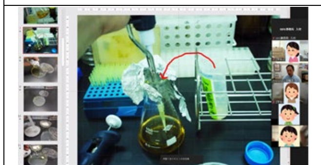
教員とのセッションの様子 (Menu2)