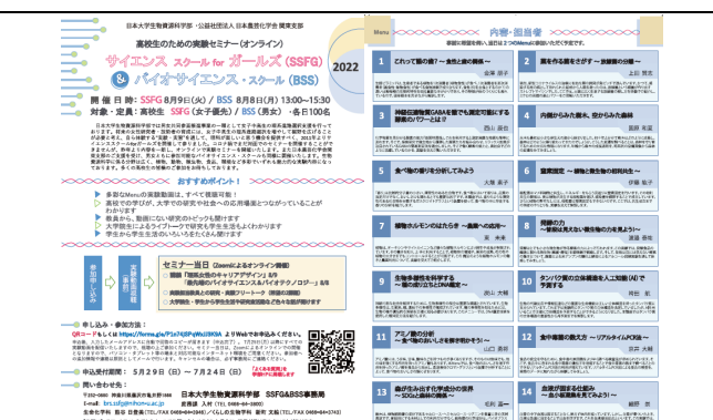
SSFG2022 リフレット (多彩な Menu)