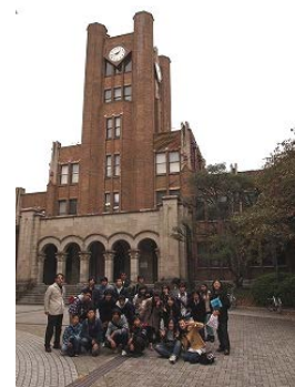
図は東京大学駒場校舎 生徒たちと記念撮影