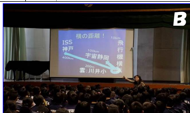
(H26) なぜ理科を学ぶか, (全校理科) 自然事象への興味・関心・意欲と進路や未来への定着と動機付け