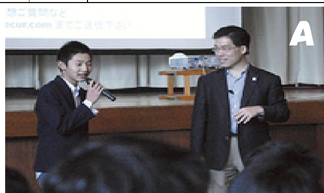
(H25) 夢叶える力, 起業家に学ぶ(全校理科) 興味・関心の方向性, 社会で役立つ科学技術への興味付け