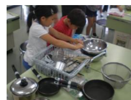
(学習したことを使う場面)