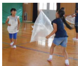
(出会わせ方の工夫)

ここでは、学習過程の工夫について述べる。1年～6年で問題解決のねらいにそった交流活動1～3を仕組み、それぞれの交流活動の場において手立てを工夫した。思いや考えをもたせる交流活動1では、実態調査をとり、子どもたちが素朴な考えを表出させることができる事象との出会わせ方を工夫することで、一人一人がそれぞれの考えをもち、自分の考えを検証する実験を行うことができた。また、高学年では、実験方法まで自分たちで考えることができた。学習したことを使って考える交流活動3では学習したことと身の回りの事象とを結びつけ、子どもたちが自ら見いだした問題を主体的に解決しようとする姿が見られた。学習したことを活用し、自分なりの方法で問題解決に取り組ませることが、子どもたちの考える力を育むために有効であることがわかった。