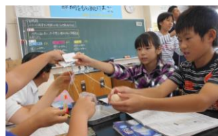
(実験方法の話し合い)