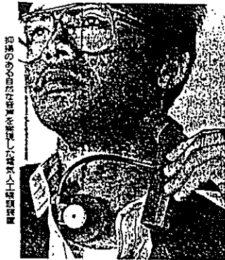
抑揚のある自然な音声を獲得し、高齢者人工聴覚装置