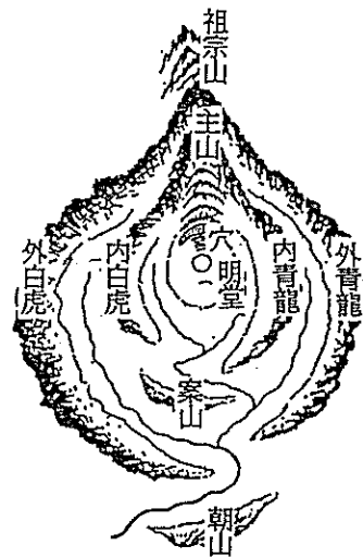
図1. 風水の概念図 (文献1より)

本節では文献調査 1)~4) を通して, 李朝建国時の開城から漢城への遷都に伴う都城の位置の選定原