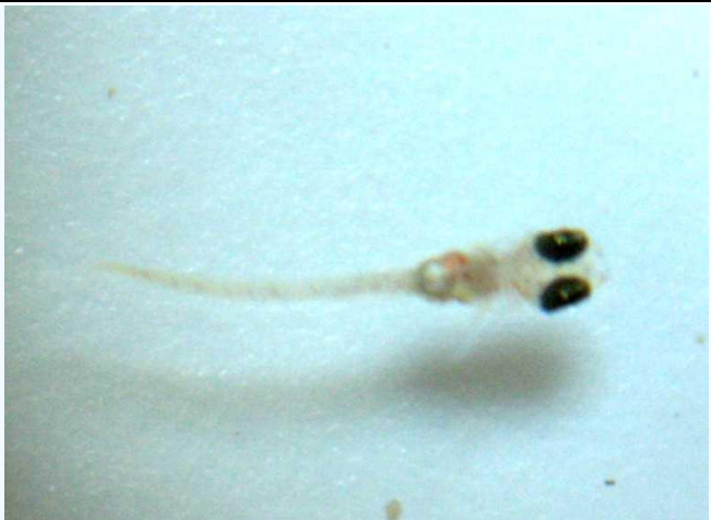
子メダカ（双眼実体顕微鏡より撮影）