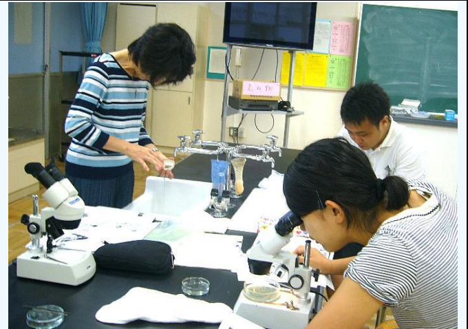
双眼実体顕微鏡を使った教職員向けの実技研修会