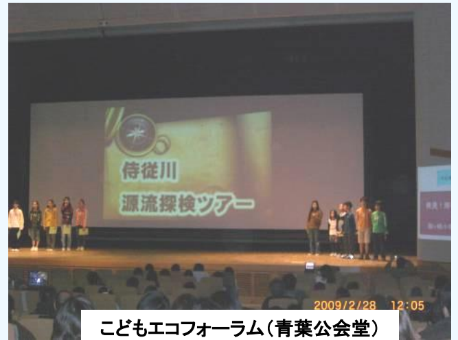
こどもエコフォーラム(青葉公会堂)