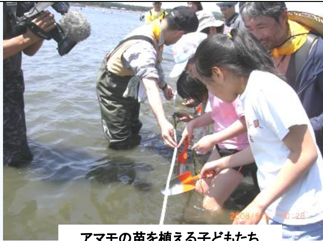
アマモの苗を植える子どもたち