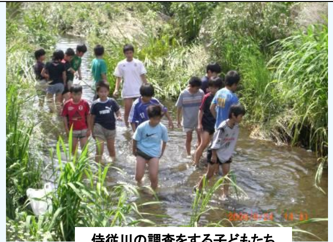
侍従川の調査をする子どもたち