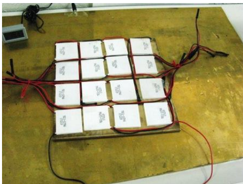
写真1: 簡易型熱電発電装置の全体図

写真1は作製した簡易型熱電発電装置の全体図を示す。16個の市販の熱電モジュールを銅板に張り付け、各モジュールは電気的には直列に接続した。写真2は簡易型熱電発電装置に氷塊を載せて発電実験中の様子を示す。負荷として小型の直流モーターを接続しプロペラを回転させる様子を写真3に示す。