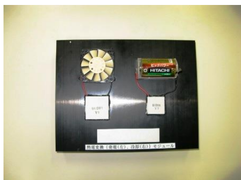
写真4:熱電発電・冷却装置の全体図

模擬授業に参加した28名の生徒全員に手のひらの体温（熱）によって発電することから始めた。写真4は、体温と室温との温度差で小型モーターを駆動させファンを回す様子を示す。冷蔵庫から取り出した清涼飲料水のガラスボトルと室温との温度差でも発電できることを示した。