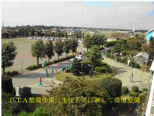
P T A整備作業に生徒も共に参して環境整備