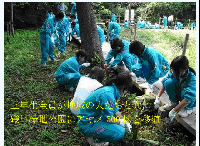
三年生全員が地域のの人たちと共に磯川緑地公園にアヤメ 500 株を移植

■実践内容：「理科の授業」「総合的な学習の時間」や「学校行事」、「生徒会活動」、「P T Aと連携した活動」や「生徒の自主的活動」等を通し、以下のような自然体験活動、勤労生産的活動、環境緑化活動等に取り組み、生徒の豊かな心を育てる環境教育を進めました。