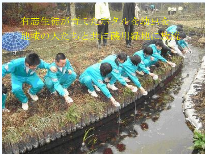
有志生徒が育てたホタルを幼虫を地域のの人たちと共に磯川緑地に放流