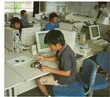
ロボット制御に取り組む児童