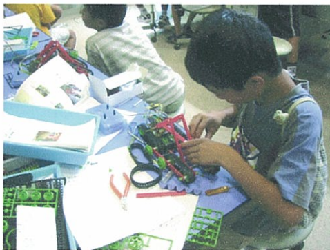
図3: 工作教室の様子(7/29@サイエンスワールド)

下記の各イベントにて、開発したロボット工作キットの完成品と競技フィールドを使用して、デモ競技および体験操縦を行った。