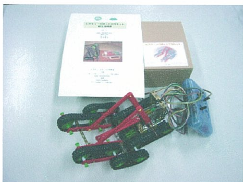
図1: レスキューロボット工作キット「R2」

工作キットに関する組立説明書を作成し、説明書冒頭にレスキューロボットの必要性や実際に活躍しているロボットの紹介などを加えることにより他のロボット工作キットとの差別化を図った。