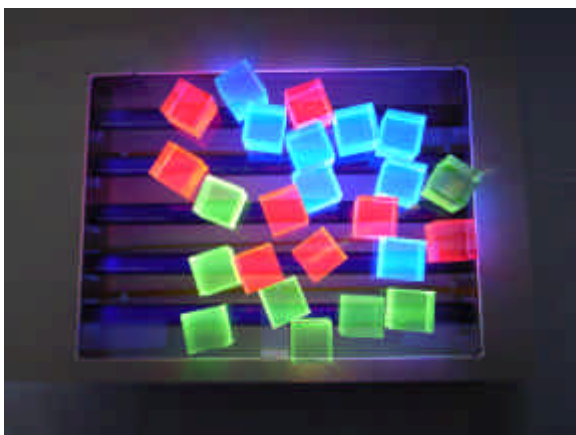
図3 光の三原色(赤、青、緑)のフォトンブロックの発光の様子

一般向けに展示が行えるまでにフォトンブロックの個数を増やした。また、特に緑色ブロックについては蛍光体である希土類錯体を改良することにより、従来のものに比べてより強い発光が得られるようになった。図3にフォトンブロックの発光の様子を示す。これにより赤、青、緑の各色をほぼ同等の明るさで発光させることに成功した。