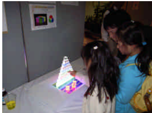
図2 ピラミット型に並べたブロックで遊ぶ小学生