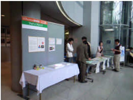
図1 大阪市立科学館での展示ブース

図2は小学生がピラミット型に並べたブロックの様子である。このように自由にブロックを組み立てて遊んでもらった。私はあまり口出しをしないように横に待機して遊ぶ様子を観察し、質問があればそれに答えた。