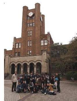
図は東京大学駒場校舎 生徒たちと記念撮影