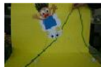
綱渡りやじろべえ