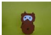
起き上がりこぼし