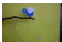
一本足のやじろべえ