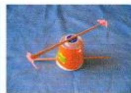
回転するおもちゃ