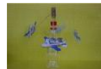
まわるやじろべえ